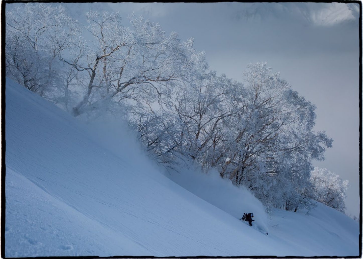
Rider : Yuko Shimomura